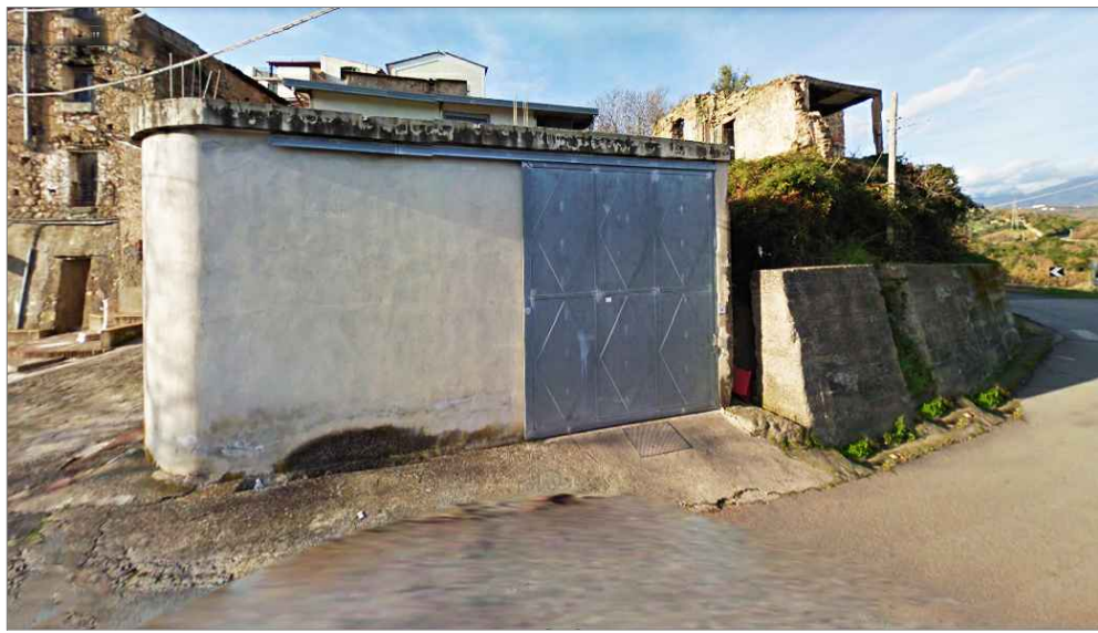
Punto di vista n. 2 si suggerisce piantumazione di vegetazione parietale