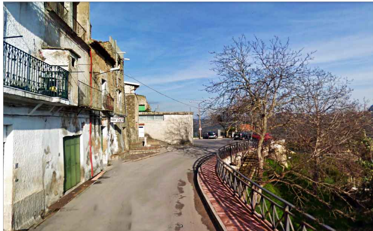
Punto di vista n. 7 ripristino corpi degradati