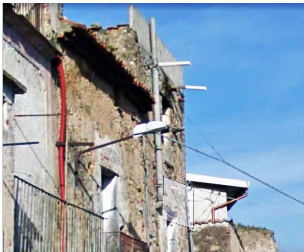
Punto di vista n. 8 ripristino intonaco