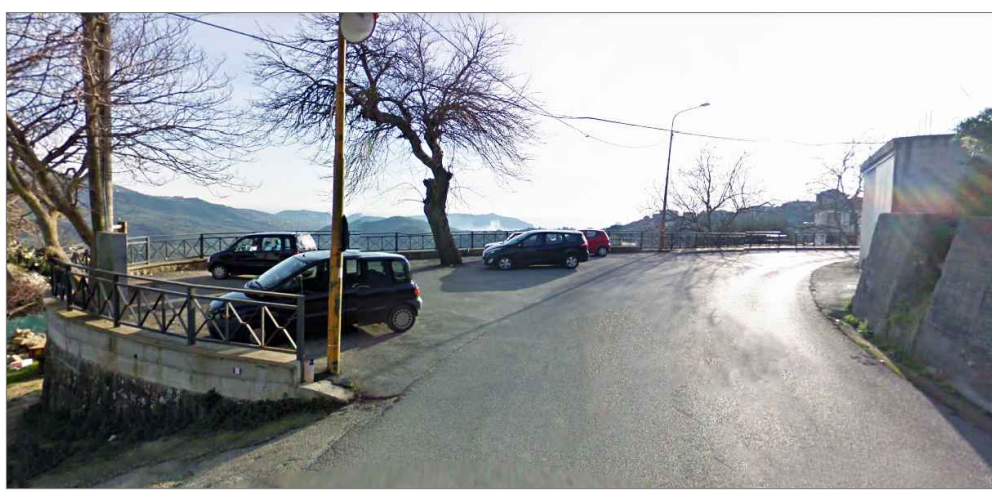
Punto di vista n. 4 corpi illuminanti specifici