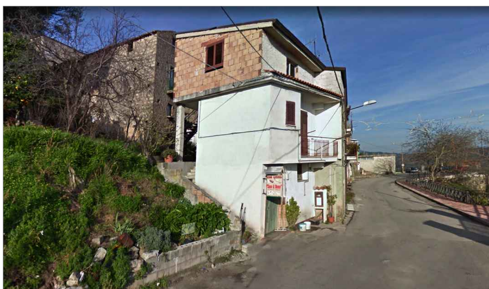
Punto di vista n. 5 ripristino intonaco e sistemazione del verde