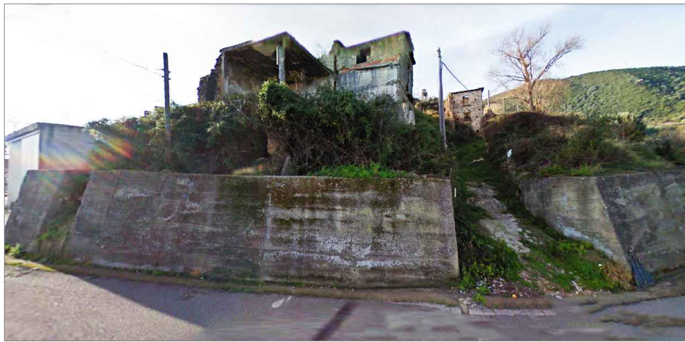
Punto di vista n. 3 si suggerisce piantumazione di vegetazione parietale