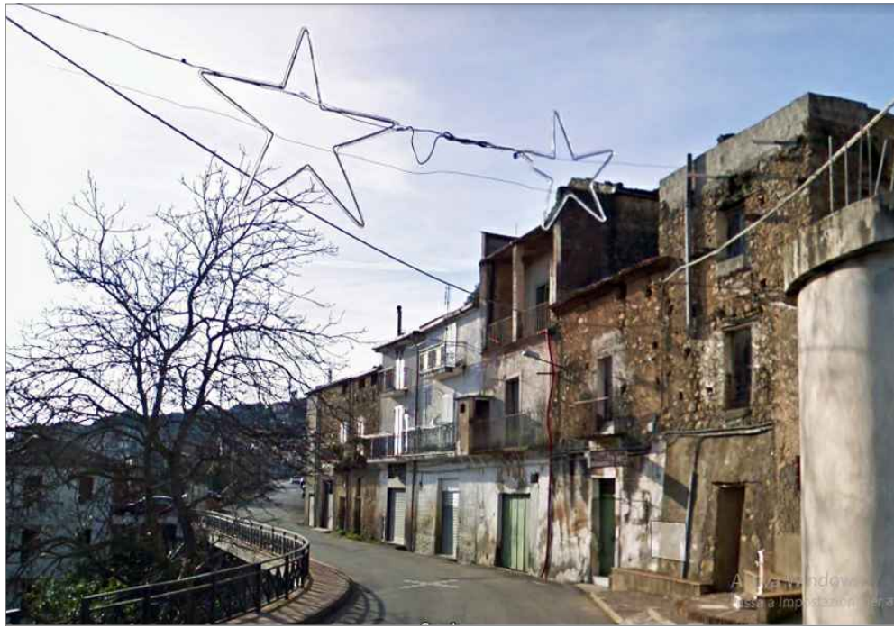
Punto di vista n. 1 ripristino intonaci